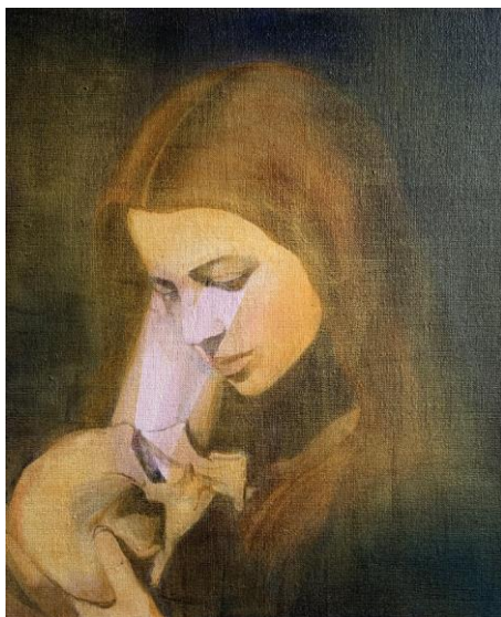
Irene Bisang, Odem , 2021 Acryl und Öl auf Leinwand 38 x 32 cm