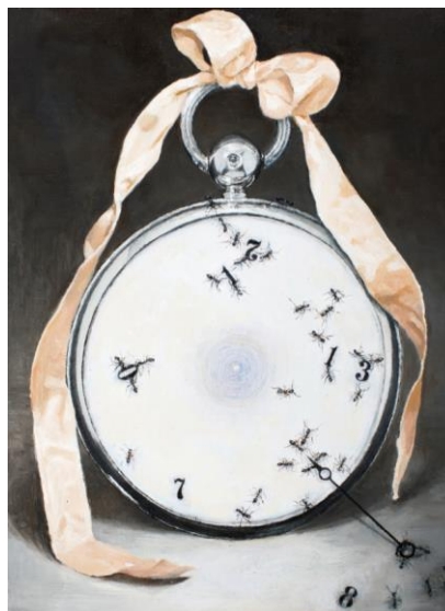
Irene Bisang, Once Upon a Time , 2009 Öl auf Holz 22 x 16,5 cm