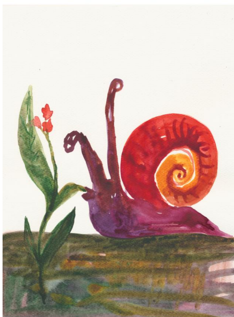
Irene Bisang, Schnecke und Blume , 2020 Aquarell auf Papier 23 × 17 cm